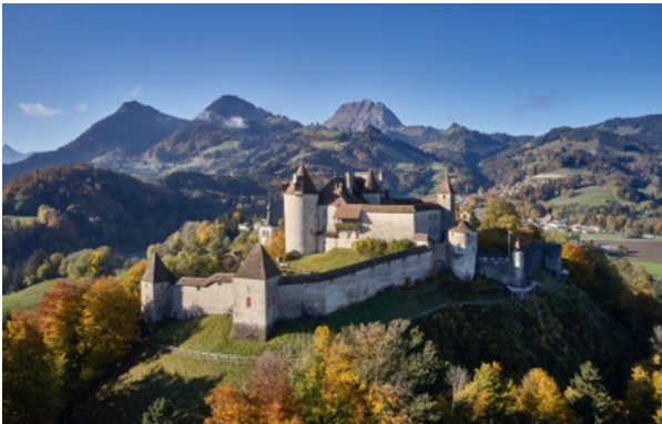
Château de Gruyères.