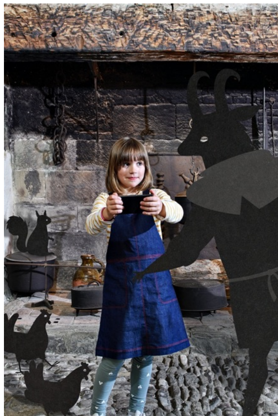
© Château de Gruyères, photo. Daniela & Tonatiuh, design Camille Scherrer