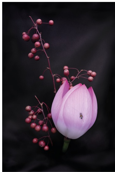
4 Crickets, 2019-2020