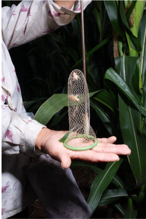
1. Crickets, 2019-2020

Die Pressebilder sind in hoher Auflösung auf www.chateau-gruyeres.ch/presse oder auf Anfrage verfügbar. Diese Bilder dürfen ausschliesslich für die Werbung für die Ausstellung verwendet werden. Das Copyright ist ausdrücklich zu erwähnen.