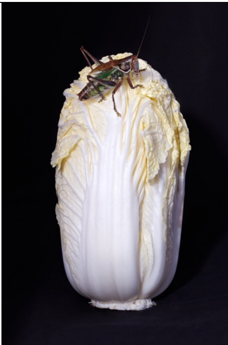
8. Crickets, 2019-2020