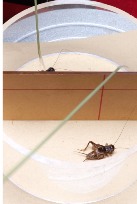
6. Crickets, 2019-2020