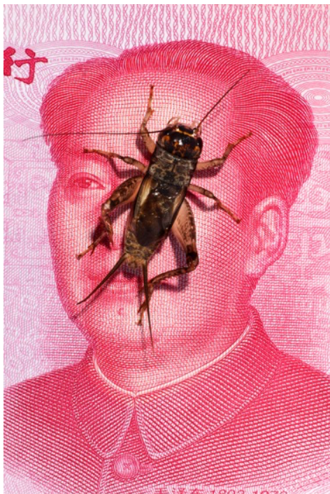
3. Crickets, 2019-2020