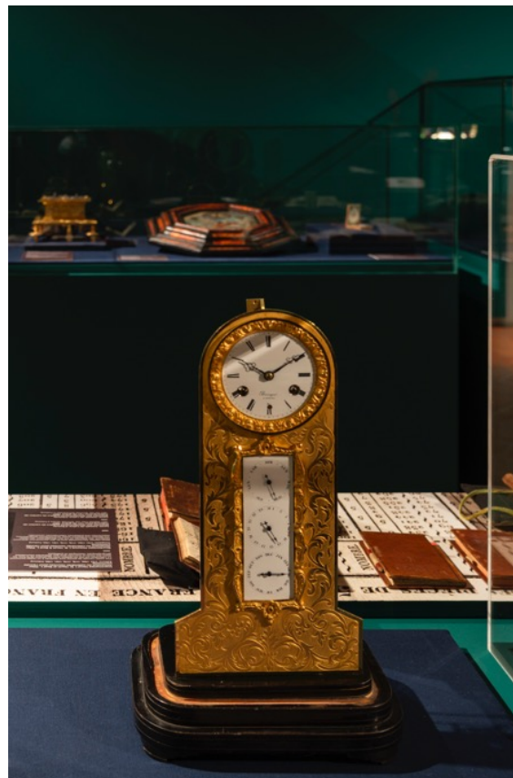
Hippolyte Bienaimé, Tischuhr mit ewigem Kalender (um 1850). Leihgabe Internationales Uhrenmuseum La Chaux-de-Fonds.