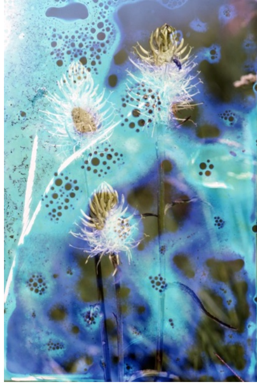
2. Action will follow vision © Maya Rochat