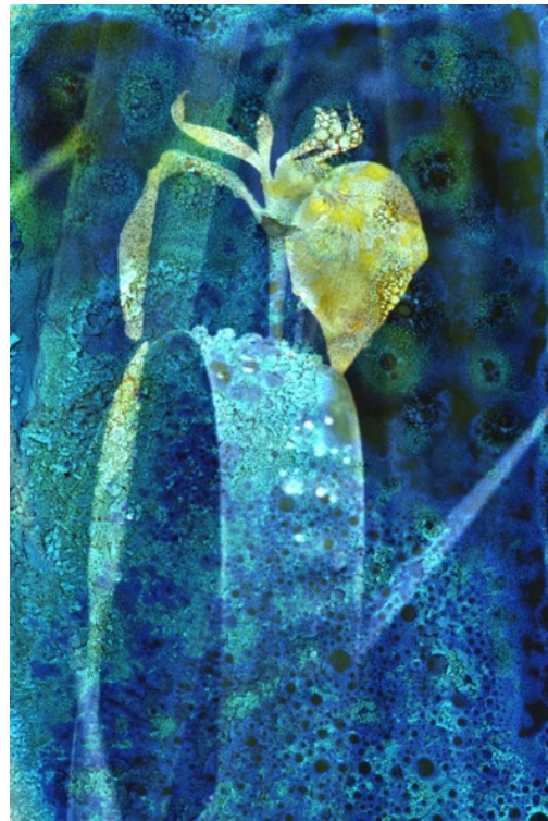
4. Action will follow vision © Maya Rochat