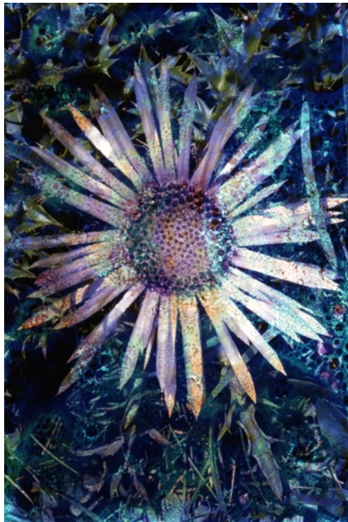
3. Action will follow vision