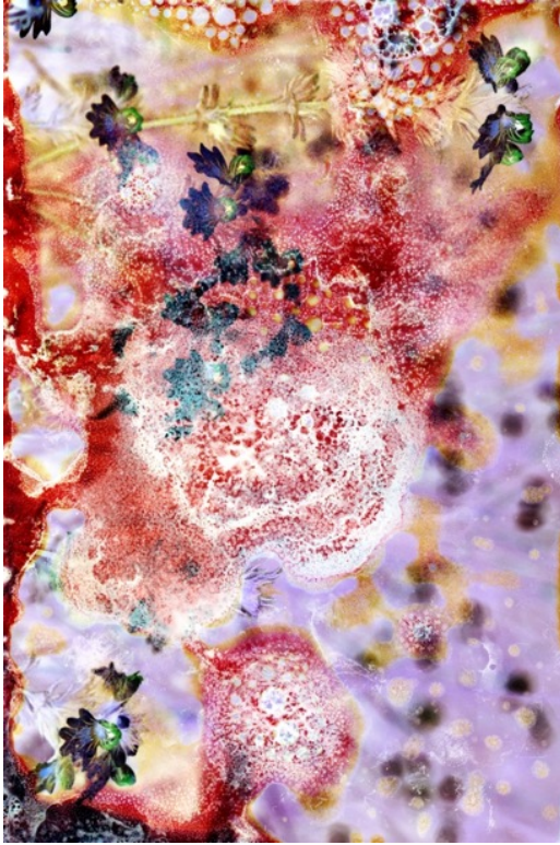
1. Action will follow vision © Maya Rochat

Les images de presse sont disponibles en haute définition sur demande. L'utilisation de ces images est strictement réservée à la promotion de l'exposition et le copyright doit obligatoirement être mentionné.